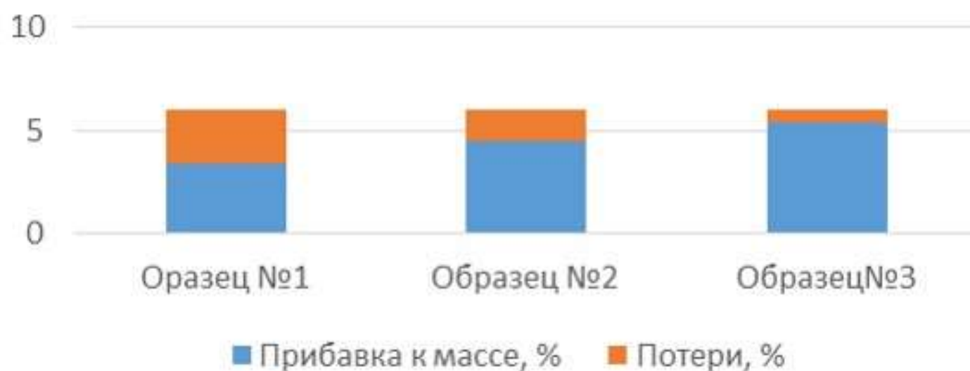
Диаграмма 1. Определение устойчивости панировки

При использовании геля на основе животного белка из высокоочищенного коллагенового сырья наблюдалось наилучшее сцепление панировочной смеси с мясом и наименьшие потери после термической обработки и разрезании куска на две половины. Наиболее наглядные результаты представлены на диаграмме 1.