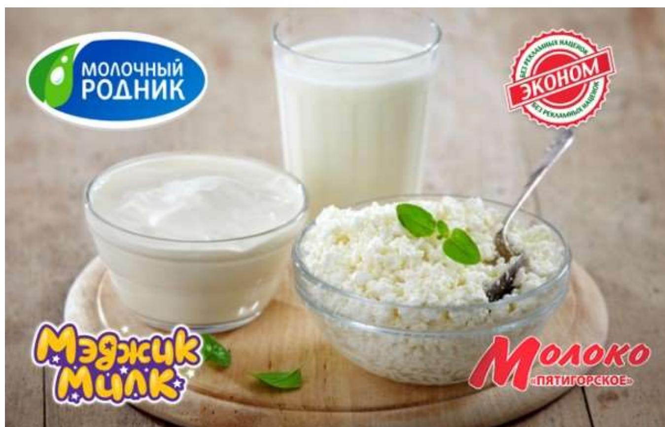
Рисунок 1. Линейка брендов ООО «Пятигорского молочного комбината» Figure 1. The line of brands of LLC "Pyatigorsk Dairy Plant"

Ассортимент продукции, производимой комбинатом, хорошо сегментирован по потребительским группам – от дешевой молочной продукции до средней ценовой категории, но с обязательной гарантией безопасности и качества. Таким образом, охватываются все самые большие категории сегментов рынка. Ассортимент насчитывает более 90 наименований различной продукции. Это линейки продукции следующих брендов: «Молочный родник», «Мэджик милк» (для малышей), «Эконом» и «Пятигорское», рассчитанные на разные вкусы, возрасты и достаток (рисунок 1).