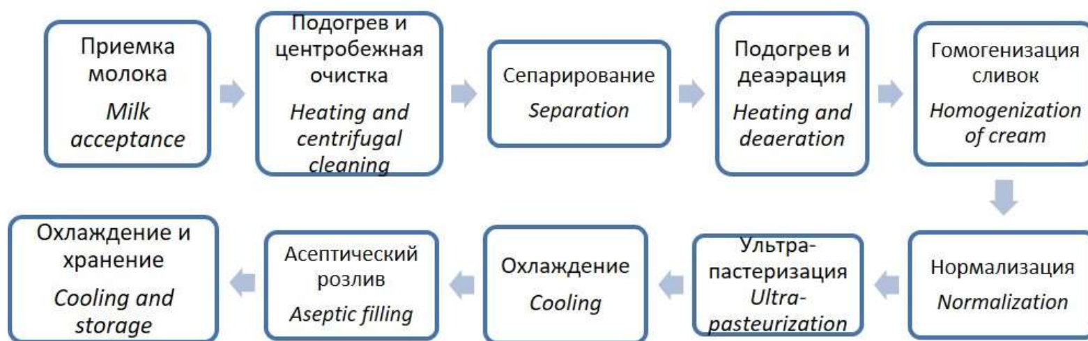
Рисунок 2. Блок-схема переработки молока-сырья Figure 2. Block diagram of raw milk processing

Как правило, все поступающее на комбинат молоко вслед за процедурой очистки подвергается сепарированию. Поэтому для получения продукта заданной жирности смешивают расчетное количество обезжиренного молока и сливок. В связи с этим на упаковке питьевого молока указывают следующий состав продукта: молоко обезжиренное и сливки.