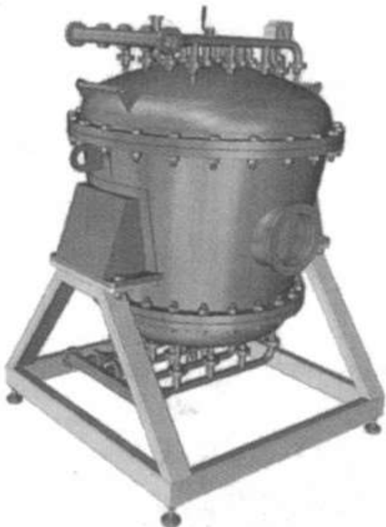
Рисунок 3. Ионообменные колонны ООО «Консит А» Figure 3. Ion exchange columns of LLC "Consit A"

Промышленный модуль для аппаратурного оформления процесса ионообменной обработки молочного лактозосодержащего сырья в статике и динамике по разработке ВНИМИ (связанной, кстати, с Чернобыльской аварией) показан на рисунке 3 [5].