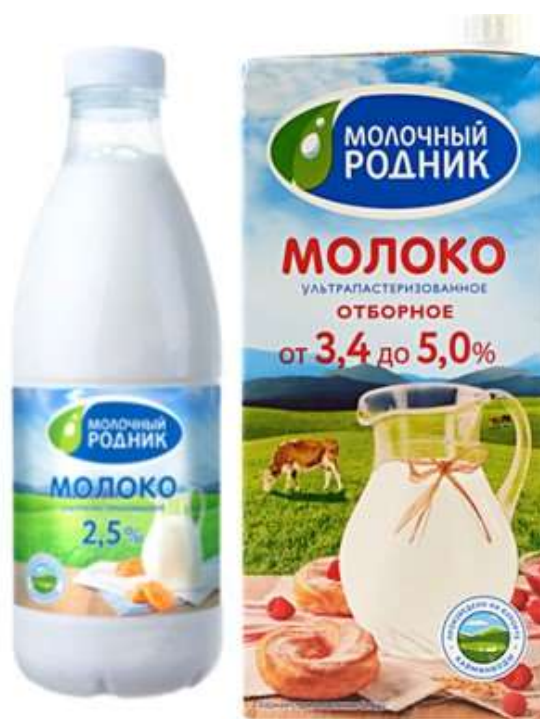
Рисунок 3. Разновидности ультрапастеризованного молока Figure 3. Varieties of ultra-pasteurized milk

Но для такого вида молока, как отборное, исходное молоко не делят на фракции. И в потребительскую тару попадает молоко фактической жирности (рисунок 3), что по достоинству оценили потребители. На сегодняшний день ультрапастеризация – максимально щадящий способ эффективной тепловой обработки молока. Всего в течение 2-4 с молоко нагревается до температуры 137°C, что позволяет гарантировать его микробиологическую чистоту, и затем охлаждается до температуры 75°C и подвергается вакууммированию с целью деаэрации, которая является дополнительным фактором, обеспечивающим его длительную хранимость.